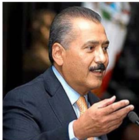
Manlio Fabio BeltronesRivera

Menuda sorpresa que me llevé -que no es lo mismo que susto - al empezar a leer que esta semana rendiría protesta Manlio Fabio Beltrones como Presidente... gulp... de la mesa directiva del Senado de la República, aahhh . Restaurada la calma y vuelta el alma al cuerpo, al constatar que no habría golpe de estado ni nada parecido, no pude dejar de pensar en cuántas veces se iría a multiplicar el poder que, ya de por sí , ostenta el ex mandatario sonorenses al erigirse, oficialmente y por segunda ocasión, en el mero mero del Senado. Y esto me trajo a la mente lo que decía don Manuel Espino, respecto a que Beltrones ejercía desde el Senado una vicepresidencia real en México; ase-